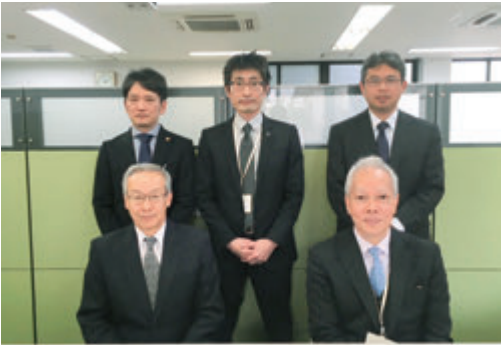
中小企業診断士や大手企業OBが皆様をコーディネート

したがって、これからのセンターの支援スタンスは「資金繰りを良くするお手伝い」です。コーディネーターは相談者に寄り添い「強みをどこに売り込むか」を一緒に考え、実行に繋げていく支援をすることを役割としています。