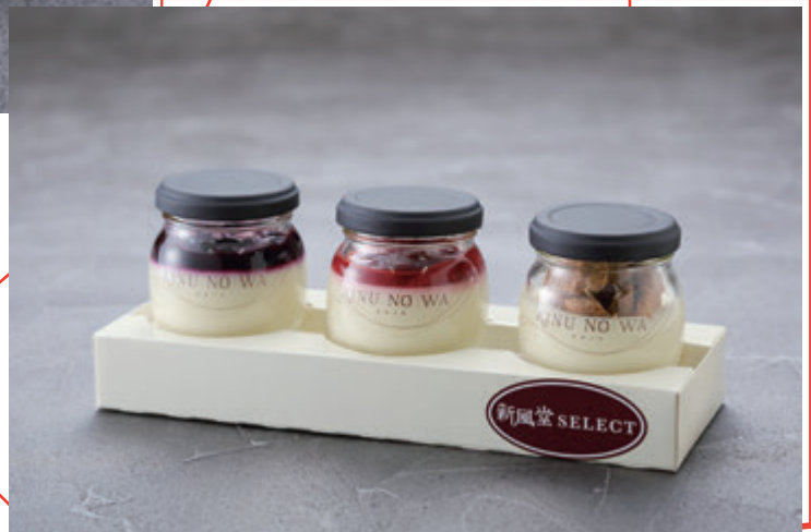
新風堂 「キノワ・ボトルチーズケーキ」